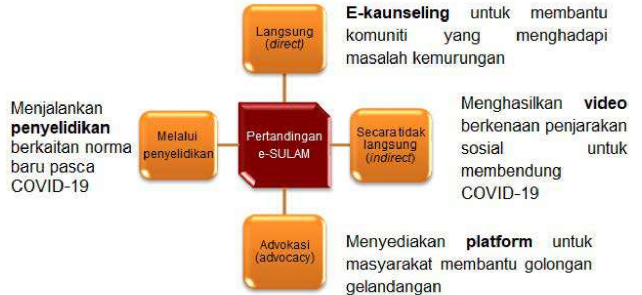
Rajah 1: Pendekatan e-SULAM